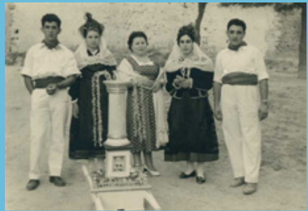
Fiesta de los Cirios, 1955.

Segovia cuenta ya, pues, con otra ‘Manifestación Tradicional de Interés Cultural’, la del diablillo, que enriquece la lista iniciada por la ofrenda de Los Cirios de Santa María la Real de Nieva y la Octava de Fuentepelayo. Así que, felicitémonos por ello y ¡a disfrutar con el diablillo la noche del próximo 23 de agosto!