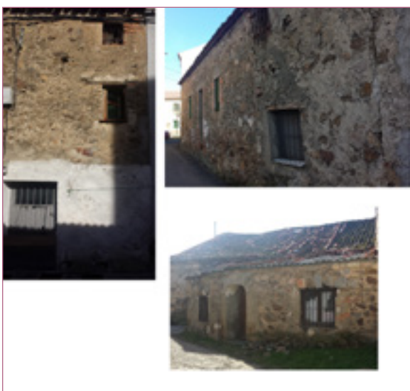
Ilustración 4. Casas vecinales en Tabanera del Monte. Mampostería revestida y tejas invertidas.

habitacional, especialmente en Palazuelos, quedando solo algún ejemplo en Tabanera del Monte.