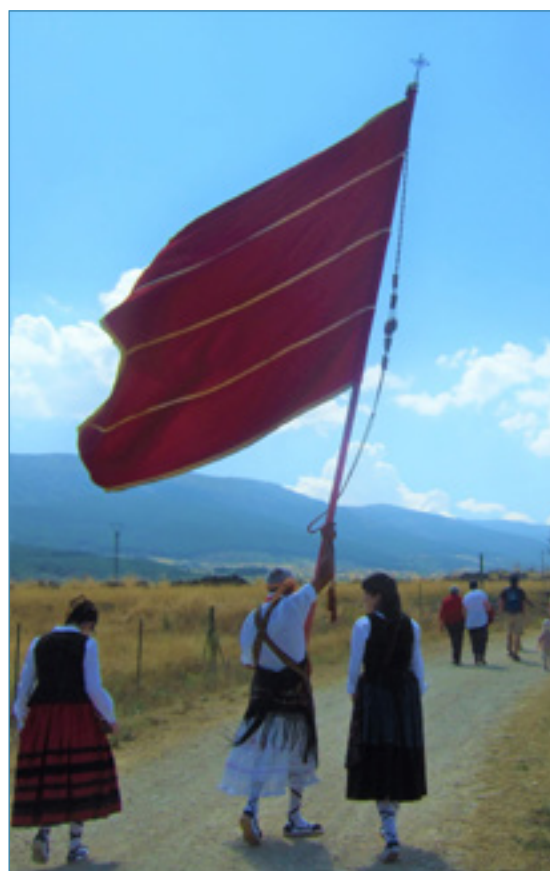
Pendón procesional de Arcones. Subida a la ermita de la Virgen de la Lastra, Sep. 2013.

1. Pendones o estandartes religiosos o civiles y símbolos concejiles en las Comunidades de Villa o Ciudad y Tierra cuyo territorio coincida en todo o en parte con la actual provincia de Segovia". El proyecto de investigación podrá proponer bien la realización de catálogos con pre-