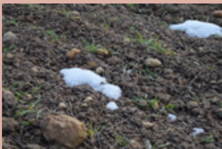
Fotografía de portada: Siembra en Zamarramala. Febrero, 2018.