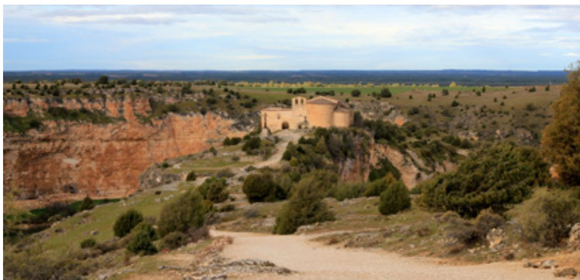
Entorno paisajístico del enclave donde se sitúa la ermita de San Frutos, sobre las Hoces del Río Duratón.