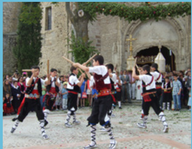
La Octava del Corpus de Fuentepelayo.

MANIFESTACIÓN IGH (2017) LA OCTAVA DEL CORPUS DE FUENTEPELAYO Fuentepelayo (Fecha movable. Primavera)