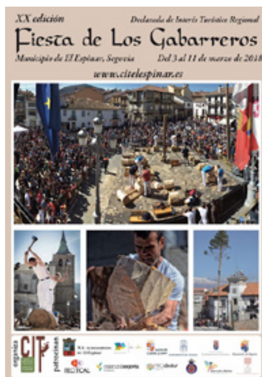
Cartel de la XX Edición de la Fiesta de los Gabarreros.

La coordinación del trabajo anual en pro de la gabarrería, un oficio vinculado a la vida en el monte y visibilizado a partir de la obra Los gabarreros de El Espinar -del periodista Juan Andrés Saiz y publicada en 1996-, implica dar contenidos y participación a distintos sectores económicos: mientras la hostelería se convierte en la sede de las Jornadas Gastronómicas, distintos ganaderos y empresarios participan en los desfiles urbanos de carga y arrastre de leña gracias al préstamo de animales y carruajes. Por otro lado, expertos cortadores de troncos mantienen en activo demostraciones que ya se constatan en la década de 1950, y el colegio público se convierte en el espacio a través del cual las jóvenes generaciones participan del conocimiento y la historia de la gabarrería, mediante la organización del concurso Coplas Gabarreras.