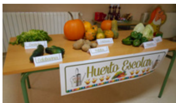
Arriba: semillas, ya plantadas: pimientos verdes, fresas o tomates, entre otros. Centro y Abajo: el huerto en época estival y actividades complementarias como exposición de semillas y productos recolectados.