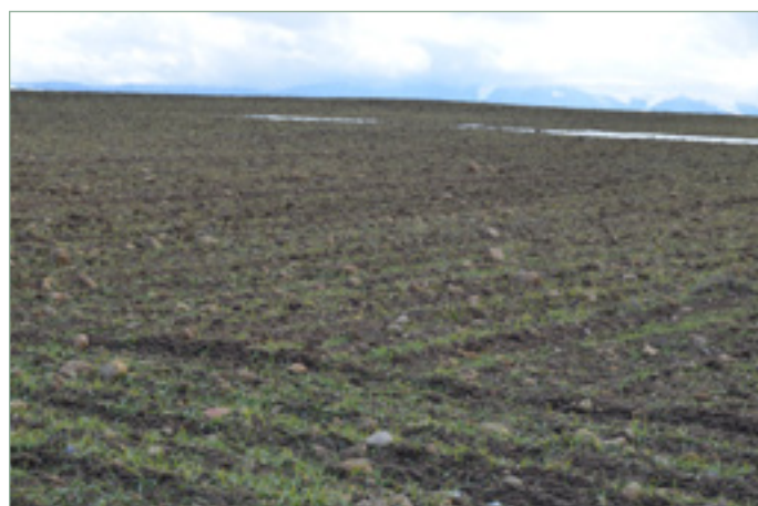
Paisaje sembrado. Zamarramala, febrero 2017.

nomusicóloga y Becada del IGH se adentra en su artículo de investigación en el Patrimonio Cultural de la Mancomunidad de "La Atalaya", y en particular de dos de sus municipios, Tabanera del Monte y Palazuelos de Eresma: de esta forma da a conocer paisajes, edificaciones, bienes inmuebles o manifestaciones festivas... "sembrando", para avanzar en su compromiso profesional: el análisis etnomusicológico y antropológico del patrimonio segoviano.