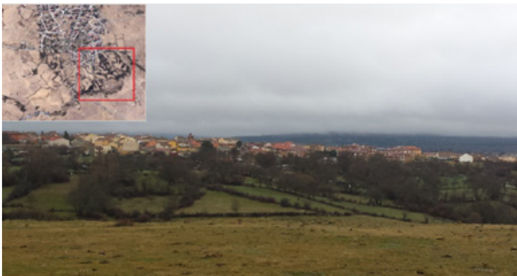
Ilustración 7. Geometrización del paisaje a partir de los cercados de piedra. Foto del satélite y real. Foto: FAC. Ene. 2018.

tipo de cultivo, muy habitual en las localidades de la Cañada Real y que a su vez generan un paisaje cultural a través de las pozas de remojarlo, en este caso perdidas pero conservadas en otras localidades como Santiuste de Pedraza. Y esta actividad económica constatada, junto con el enclave geográfico del municipio entre la Cañada Real y el Río Eresma, dará lugar a muchos de los ejemplos dentro del patrimonio cultural material inmueble: la arquitectura tradicional.