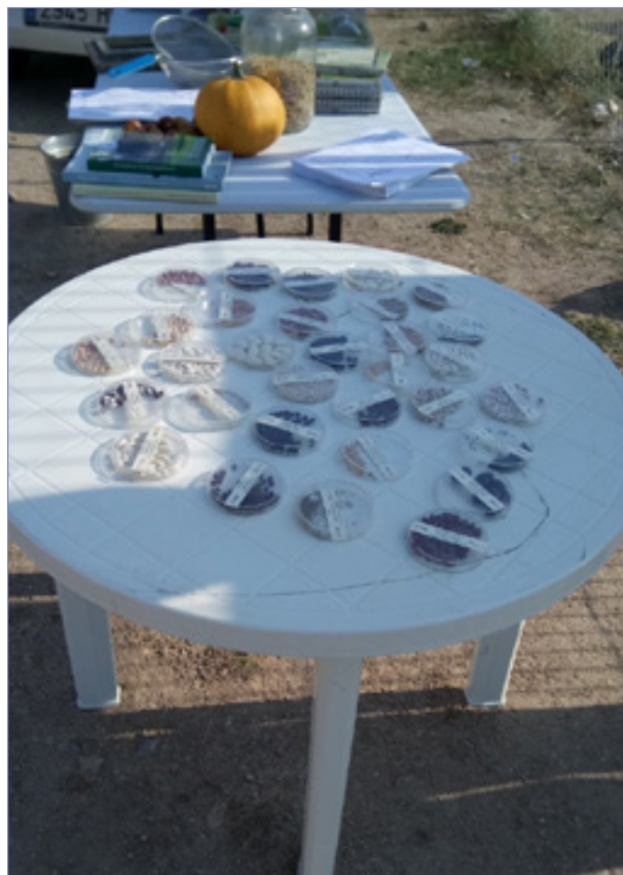
Exposición de semillas tradicionales en Abades.

En el año 2010, la Unión de Campesinos de Segovia (UCCL), emprendió el proyecto Semillas Vivas, acerca de las variedades de cultivo y razas ganaderas tradicionales que se pueden documentar en la provincia de Segovia. Este proyecto llegó a generar una web en la que se reflejaba información y fotografías sobre los recursos genéticos agroalimentarios de la provincia, sus métodos de manejo y conservación tradicionales, sus usos culinarios, medicinales, industriales, y toda la cultura agraria asociada a ellos.