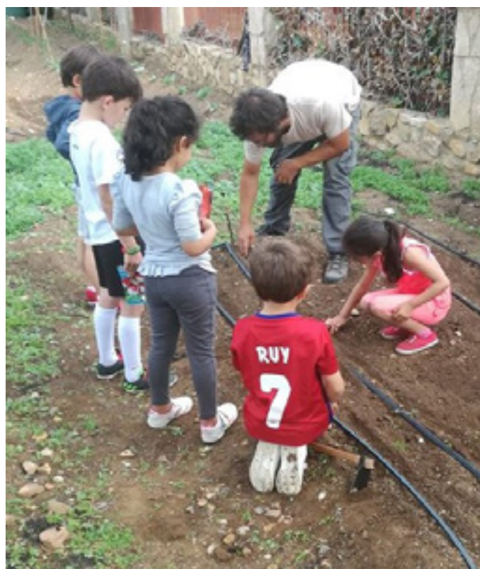
Arriba: Jornada de Huerto escolar en Abades. Abajo: Jornada de Huerto escolar en Riaza, en el patio de la Residencia de Mayores.