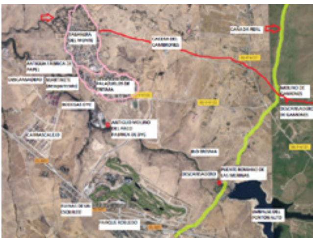
Ilustración 2. Lugares más emblemáticos del municipio.