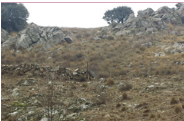
Ilustración 3. Palazuelos de Eresma 2018. Orilla derecha del río Eresma y por encima de la zona conocida como "Entreaguas". Granito y cercas de piedra.