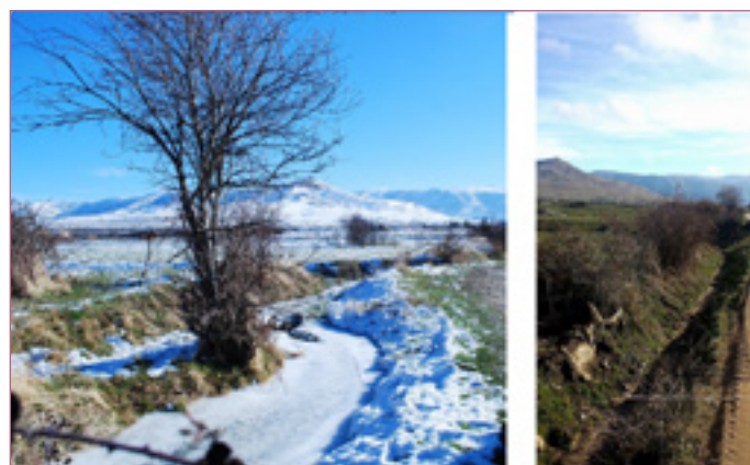
Ilustración 6. Cacera del Cambrones a su paso por Tabanera del Monte. Imagen de la cacera helada y nevada (Dic. 2010), y la cacera seca (Dic. 2017).

Marqués del Arco, que aparecen nombrados como hermanos de la cofradía, así como también dejan constancia en las cuentas del esquileo de Pellejeros, despoblado de este municipio. Aún así, por ejemplo, desde 1688, las cuentas de la imagen del Rosario de Tabanera y Palazuelos aparecen separadas, tal como sucede igualmente con los gastos en arreglar la bandera, para la que cada uno de estos núcleos paga la mitad que le corresponde.