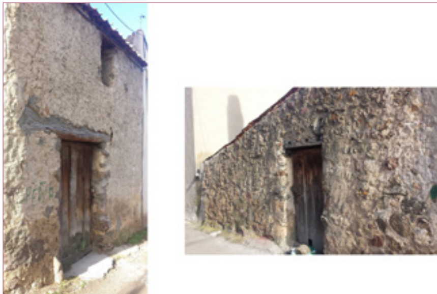
Ilustración 5. Cuadras y pajares en el entorno de Tabanera. Igualmente contruidos en mampostería de granito revocada, y con cubiertas de tejas invertidas. Foto: FAC. Dic. 2017.

Parte del pasado y de la cultura tradicional de este municipio quedaron reflejados en los libros de la Cofradía del Rosario, donde a su vez se muestra una celebración conjunta de la Función del Rosario entre los distintos anejos del municipio, incluidos los habitantes del molino del