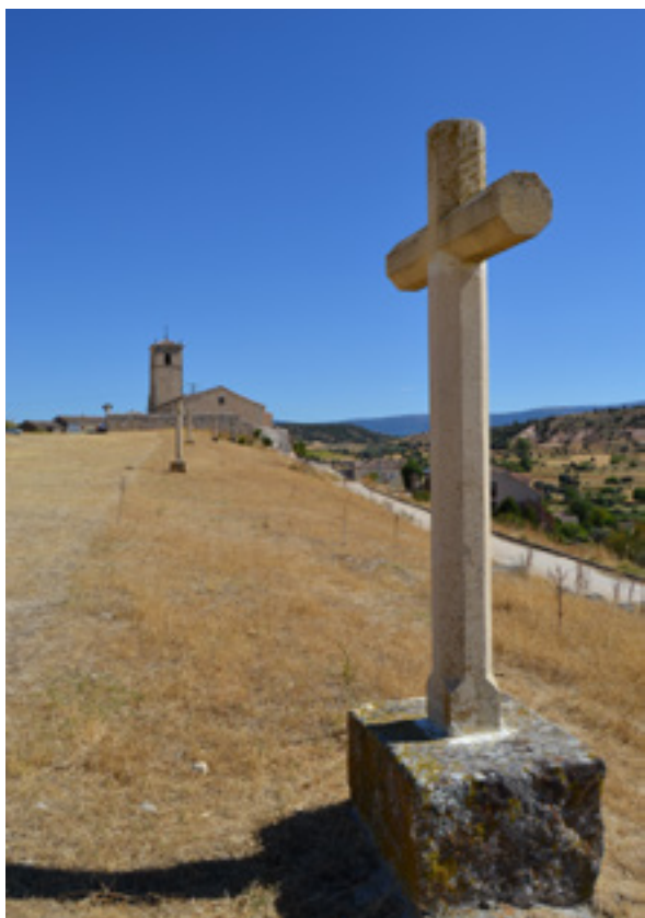
Viacrucis y iglesia de Valleruela de Pedraza, al fondo. Foto: E. Maganto, 2015.

Algunos de los paisajes que, a nuestro juicio, presentan mayor interés son, sin duda alguna, los paisajes sagrados o simbólicos que, como apunta Margarita Ortega, son espacios de representación que incorporan experiencias de carácter sensorial. Son “ aquellos [lugares] con capacidad para comunicar, guardar la memoria y transmitir información, desarrollado a partir del análisis de las características y condiciones de los espacios singulares y de los hechos o acontecimientos cuando los resultados son destacables (events places) ” (SABATÉ BEL, 2004). Frente a otros tipos de paisajes, los sagrados ofrecen multitud de posibilidades de análisis que, hasta la fecha, apenas han comenzado a dar sus frutos. Son paisajes que pueden ser estudiados desde multitud de disciplinas, no solo desde la antropológica, la que sin duda mejor juego puede dar, sino también la histórica, la artística o la económica; se puede hacer además desde un elemento definidor que lo caracteriza -un crucero o una ermita, por ejemplo-, pero también desde una manifestación inmaterial -un ritual determinado-, o desde la singularidad respecto a los paisajes colindantes. Las posibilidades pueden ser, en este caso, infinitas.