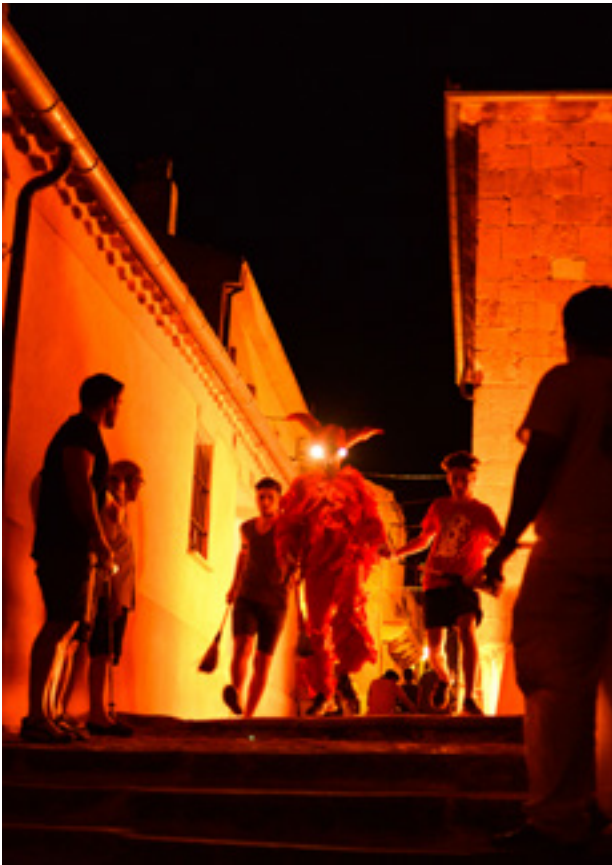
Uno de los Diablillos de Sepúlveda en la noche de San Bartolomé (cada 23 de agosto).

D iez de la noche de cada 23 de agosto. La Plaza de España de Sepúlveda permanece totalmente a oscuras. Una multitud se arremolina al pie de las escaleras de la iglesia románica de San Bartolomé. El vociferante público, mayoritariamente juvenil, reclama la presencia del protagonista del rito. Es la hora del diablillo. Puntual a su anual cita, el diablillo aparece tras una gran hoguera -encendida un rato antes- y se planta en lo alto de la escalinata de San Bartolomé. Desde la Plaza de España, la multitud le ve. En realidad, no se trata de un único diablillo. Son media docena, para así irse turnando en su misión. Resultan inconfundibles. Van vestidos de rojo, portan escoba y llevan adheridas a ambos lados de la cabeza sendas pequeñas linternas para alumbrar su paso entre la multitud. Cada uno tiene dos escoltas o 'diablillos menores', situados a derecha e izquierda y vestidos de ne-